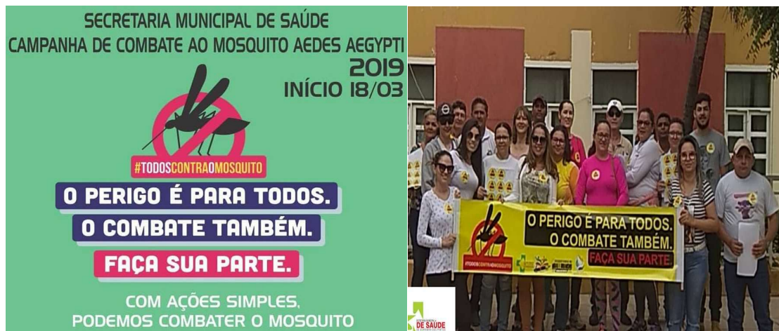
Figura 2: Registro fotográfico da participação da equipe do núcleo na campanha de combate e controle ao mosquito transmissor da dengue, Chikungunyam, zika e a microcefalia.