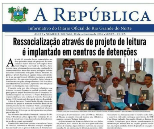
Foto 8 : Ressocialização através de Projeto de Leitura

Ressaltando que o desenvolvimento deste projeto teve como escopo a promoção da ressocialização do detento, a qual constitui o fim máximo dessa pasta, Secretaria da Justiça e da Cidadania do Rio Grande do Norte – SEJUC, possibilitando a reinserção daqueles que cometeram crimes na sociedade, garantindo a observância da dignidade da pessoa humana, evitando a reincidência e contribuindo para a promoção da paz social, a figura 8 retrata o relato acima.