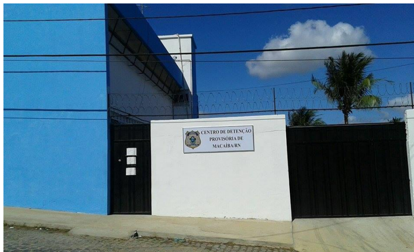
Figura 1 – Fachada CDP Macaíba