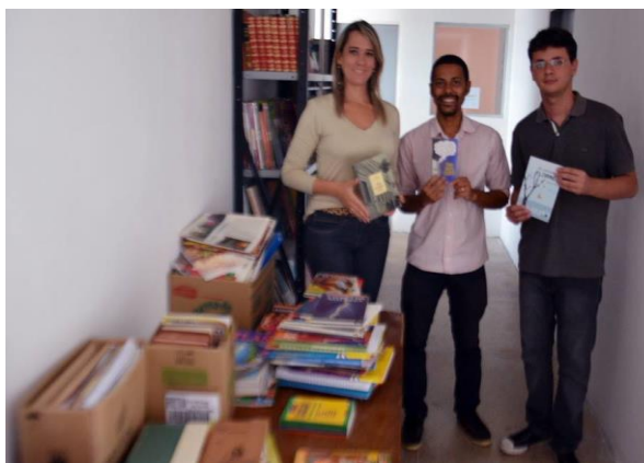
Figura 7 – Doação Prefeitura Macaíba

Ressaltando que o desenvolvimento deste projeto teve como escopo a promoção da ressocialização do detento, a qual constitui o fim máximo dessa pasta, Secretaria da Justiça e da Cidadania do Rio Grande do Norte – SEJUC, possibilitando a reinserção daqueles que cometeram crimes na sociedade, garantindo a observância da dignidade da pessoa humana, evitando a reincidência e contribuindo para a promoção da paz social, a figura 8 retrata o relato acima.