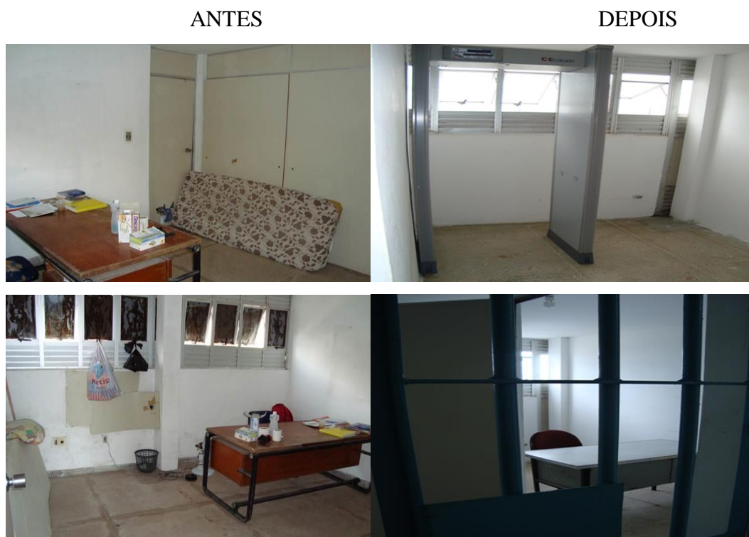
Figura 4: Sala de Procedimentos

Procedimento estes de suma importância para a segurança da Unidade e de realização rotineira. As revistas ocorriam em um local onde os presos trabalhadores viviam, com colchões e seus pertences expostos. A figura 4 mostra claramente à precária e absurda condição anterior, além de insegura, vexatória não só para detentos e familiares, como para os próprios profissionais de segurança que ali tentavam cumprir o seu dever.