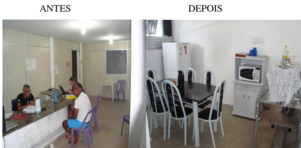
Figura 5: Refeitório

A figura 5 mostra o antes e depois, com a absurda situação com os detentos soltos, junto ao agente prisional. Ou seja, a falta de procedimento de segurança e de espaço adequado para a realização das refeições diárias do agente de segurança.