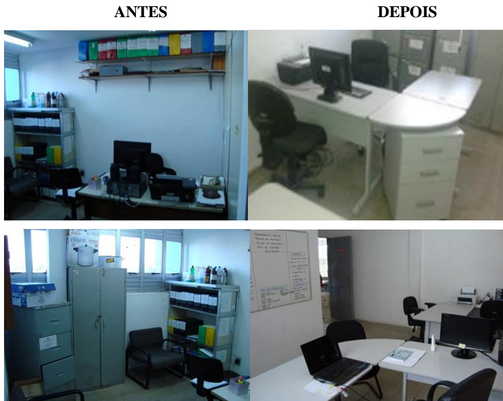
Figura 3: Sala da Direção

Equipamentos e utensílios de copa/cozinha: Aquisição de equipamentos (fogão, armário, micro-ondas, mesa, ventilador, cuba quente, liquidificador e cafeteria) e utensílios de cozinha (panelas e tambor para lixo), ambos são destinados à utilização dos serviços nos plantões de 24h. A figura 3 anexada, a seguir, mostra o antes e depois da Sala de Direção do CDP Macaíba.