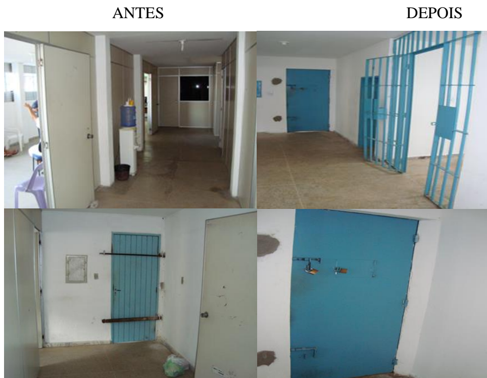
Figura 6: Área Central CDP Macaíba

A figura 6 ilustra a parte Central do Estabelecimento Prisional, parte das grades de contenção e os portões de aço instalados.