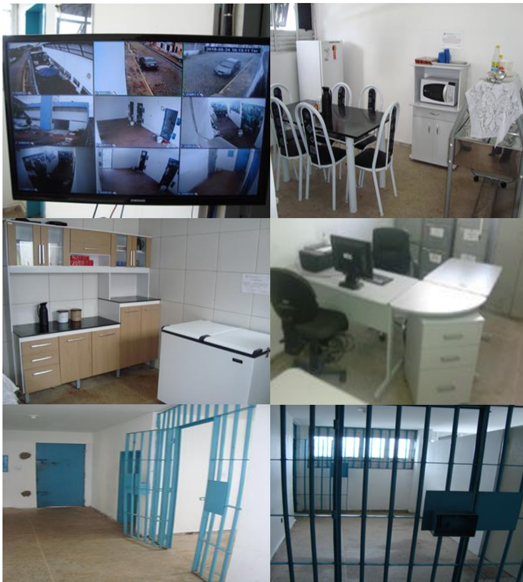
Figura 2 – Aquisições e Construções

A figura 2, a seguir, ilustra alguma das aquisições e mudanças realizadas através do referido projeto no Centro de Detenção Provisória de Macaíba.