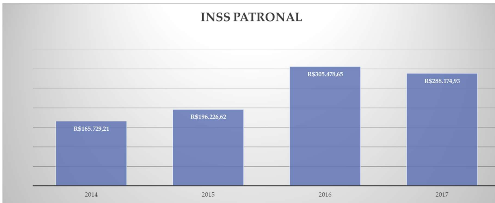
Gráfico – INSS Patronal referente aos contratados (funcionários autônomos) lotados na Secretaria Municipal de Saúde de Currais Novos(RN), Período base 2014-2017